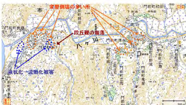
図2 門前町道下および館～走出の被害分布