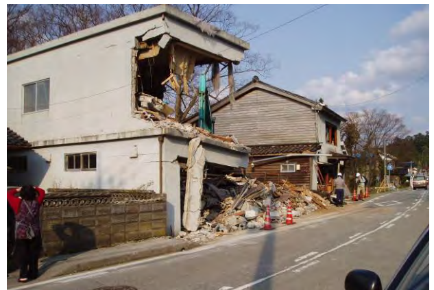
図3 輪島市門前町館での被害（多くの家屋が東西方向に倒れた）

この付近はこの北の八ヶ川の低地よりも数m高い微高地である。この微高地上において、全壊家屋が多数みられた。この付近には丸井戸が多数存在し、地下水面は地表面から1m程度と高い。また、この地域は地すべり崩壊地の末端部に位置している。よって、地下水位が高く軟弱な崩壊堆積物上に位置することが推定されることから、強震動となったものと推測される。