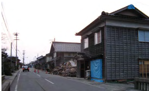
図 8 道下西部の微高地の被害状況