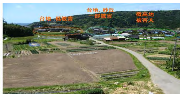
図 9 道下の南から見た微高地と被害状況

以上のように平野縁辺部の斜面崩壊堆積物による微高地上で大きな被害がみられた。千葉県内では、房総半島南部の地すべり地帯に同様な地質環境がみられる。また、下総台地の谷津田を残土石で覆った部分も同様な地質環境が考えられる。これらの場所では同様な被害が起こる可能性がある。