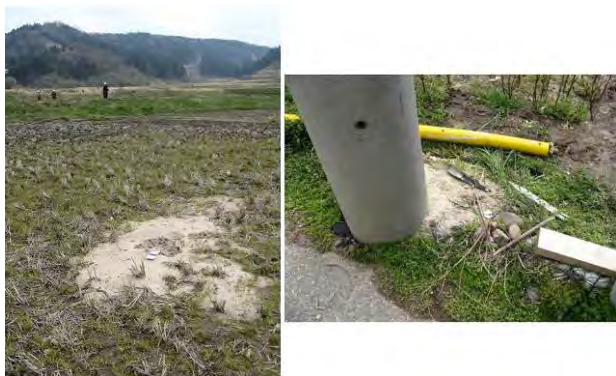
図 6 道下地区南部の微高地の裏側にみられた噴砂（砂はアレナイト質の細粒砂である。）

この付近は、谷の出口の扇状地状の微高地である（図 2）。この微高地の北側、西側及び微高地の東側にある城谷川沿いで全壊家屋が集中してみられた。微高地上の深刻な被害があった部分では地下水位が高い。微高地から下った八ヶ川沿いでも全壊家屋が見られた（図 7）。なお、城谷川沿いではわずかではあるが噴砂がみられた。噴砂の砂はアレナイト質の淘汰の良い海浜砂のような砂であった（図 6）。この地域は広い地すべり地を伴う城谷川の谷の出口の扇状地状の微高地であることから、館と同様に厚い沖積層の存在による強震動による被害が推測される。なお、道下地区西縁の海側は周囲よりもさらに高い砂丘地であり、そこでは建物の損傷は軽微であった（図 8, 9）。