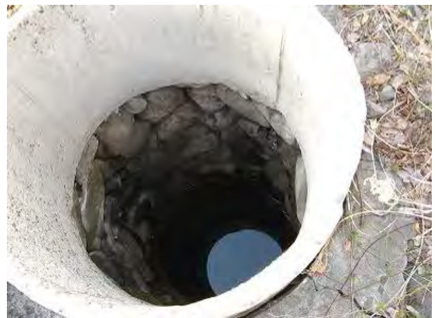
図4 館における丸井戸（地下水位が浅い）