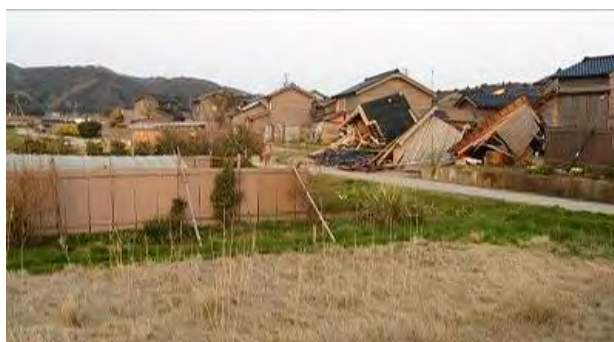
図 7 道下北部の微高地下の低地での被害