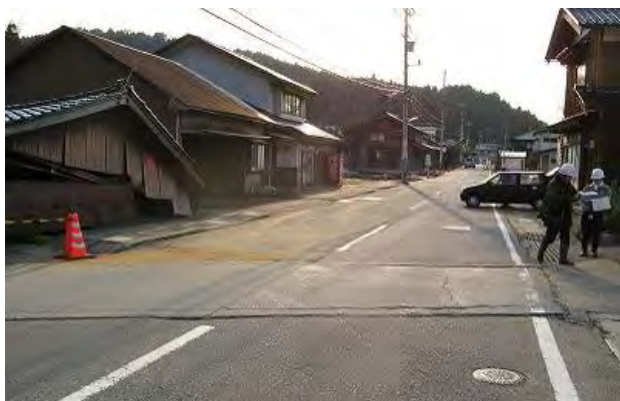
図 5 館における家屋の倒壊（道路面に凹凸がみられる）